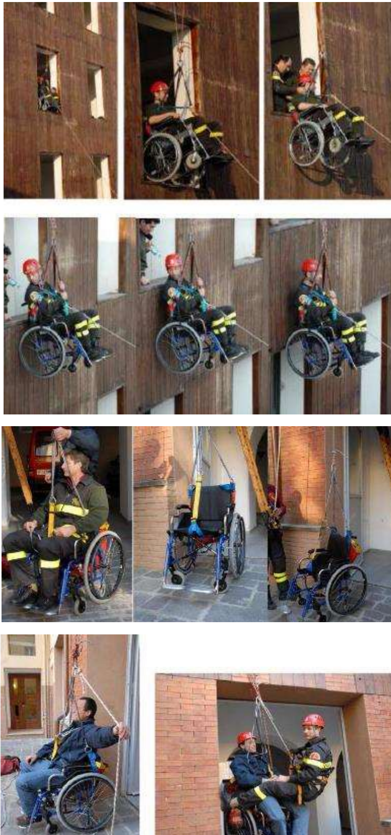
Shembull i përdorimit të mjeteve ngritëse për evakuim

Udhëzues për ekipet e shpëtimit dhe ndihmës së parë: Ballafaqimi me personat me aftësi të kufizuara në raste urgjente