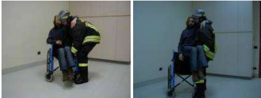
Metoda Cradle Carry për bartje nga një person i vetëm

Udhëzues për ekipet e shpëtimit dhe ndihmës së parë: Ballafaqimi me personat me aftësi të kufizuara në raste urgjente